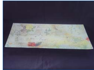
Bandeja 10 €

Este es un pequeño muestrario de los artículos que elaboramos en el centro de día de adultos de Barakaldo y que están visibles en el escaparate de la calle Larrasolo 11 Barakaldo.