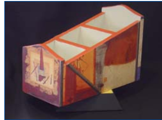
Porta mandos 8 €