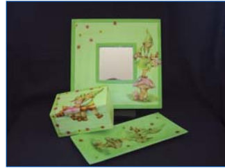
Conjunto 5 € c/u.