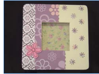
Moldura 6 €